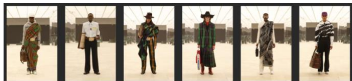
Image 7: Louis Vuitton par Virgil Abloh, collection automne / hiver 2021, silhouettes 61 & 65.

https://fr.fashionnetwork.com/galleries/photos/Louis-Vuitton,36906.html