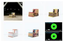
Image 2 : @canary__yellow : instagram créatif de Virgil Abloh regroupant ses différentes formes d'art

https://www.instagram.com/canary__yellow/